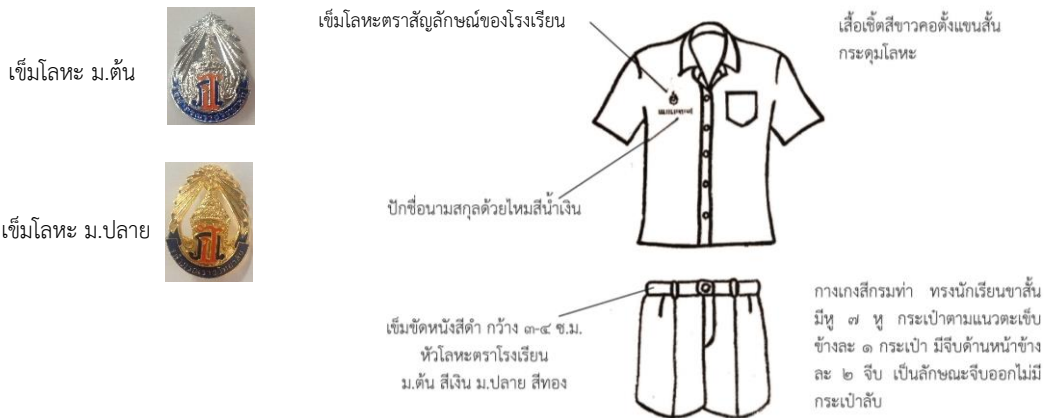
ชุดนักเรียนชาย ม.ต้น