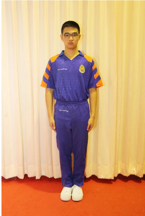
ชุดพลະนักเรียนชาย