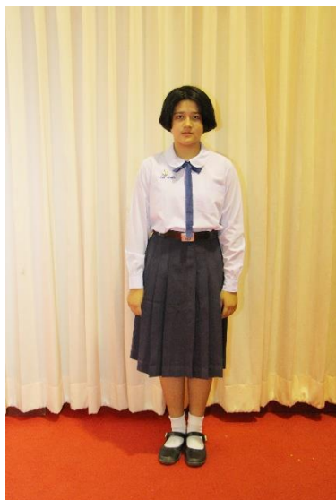
ชุดนักเรียนหญิง ม.ต้น